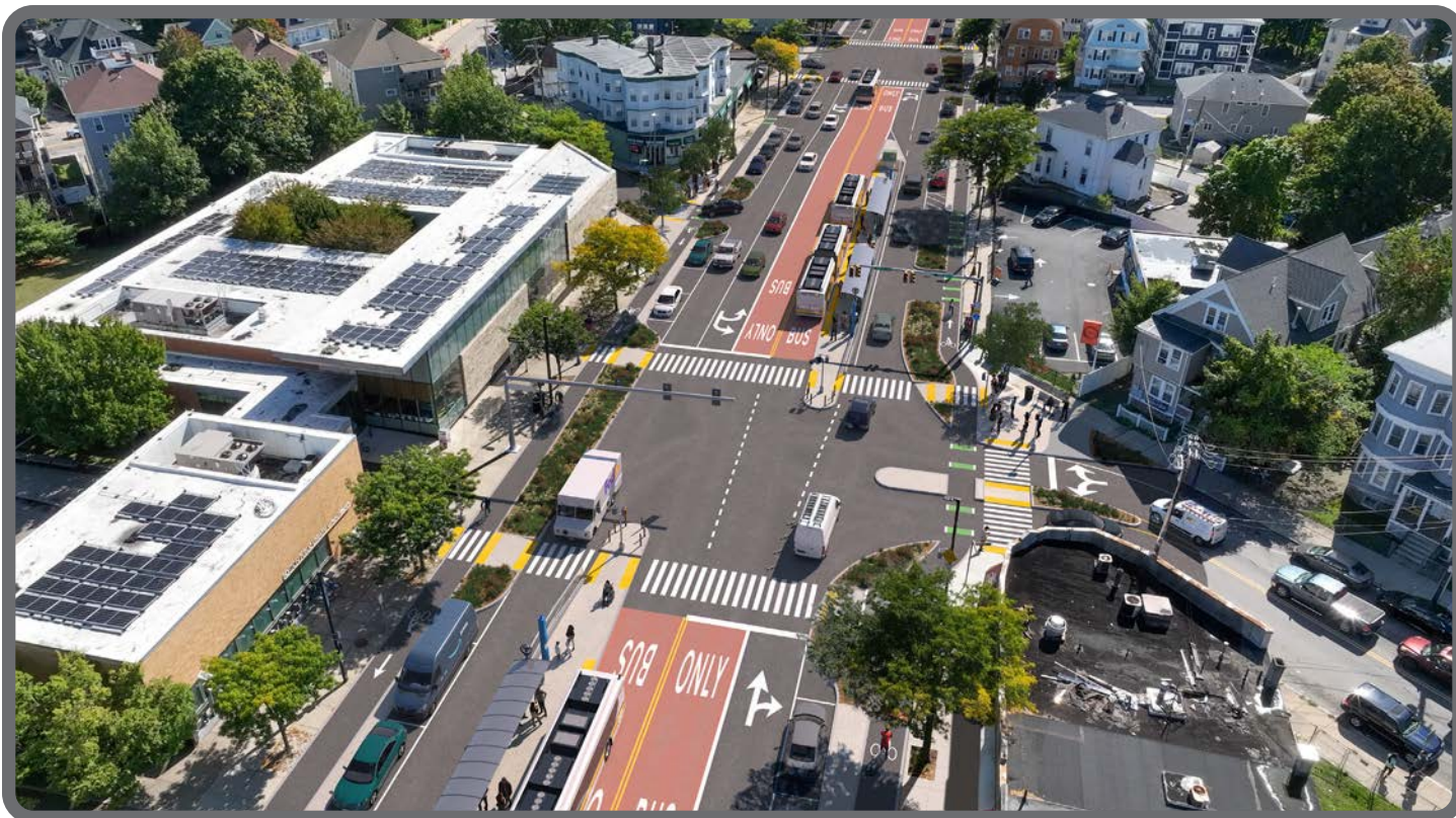
Bản vẽ thiết kế sơ bộ của Đại Lộ Blue Hill tại Phố Walk Hill, nhìn về phía Nam.

Vui lòng truy cập mbta.com/ BlueHillAve để xem thông tin này bằng tiếng Việt, tiếng Tây Ban Nha, tiếng Haiti Creole, tiếng Creole Cape Verde hoặc tiếng Bồ Đào Nha. Để yêu cầu dịch sang các ngôn ngữ khác, vui lòng liên hệ BetterBusProject@MBTA.com.