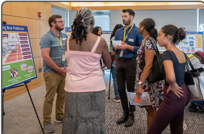
Những người tham gia Sự Kiện Mở Cửa Tự Do Mattapan vào tháng 6 năm 2024 đã chia sẻ những ý tưởng và hy vọng của mình về Đại Lộ Blue Hill.

Xuyên suốt con đường, nhóm dự án đã nỗ lực để duy trì càng nhiều chỗ đậu xe càng tốt, đặc biệt là ở những khu vực có nhu cầu cao hơn. Thành Phố Boston sẽ tiếp tục phát triển các quy định về lề đường, cho dù đó là thêm khu vực đón/trả khách hay đậu xe dài hạn hơn, để đảm bảo đáp ứng nhu cầu của các doanh nghiệp và cư dân dọc theo con đường.