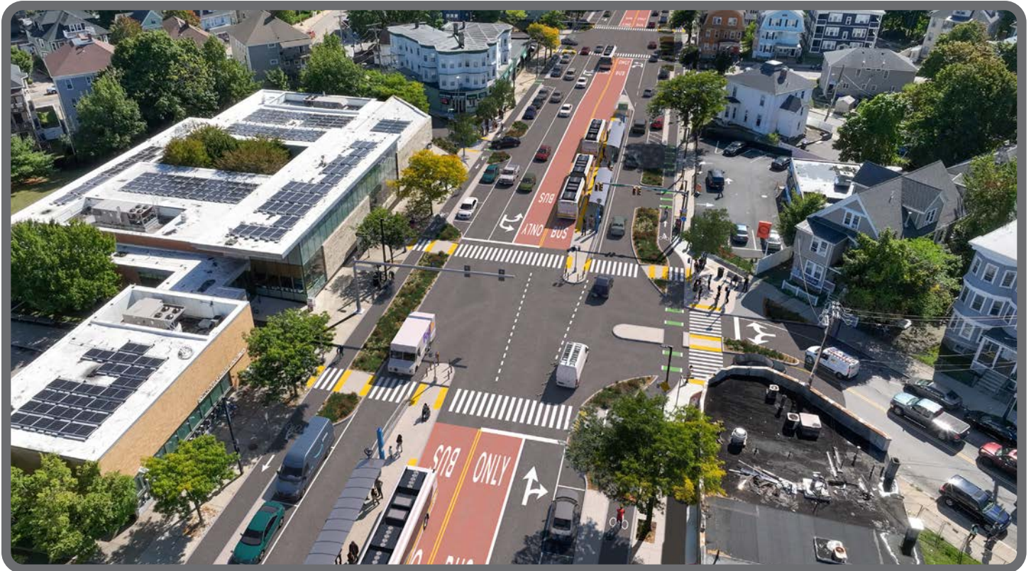
Apresentason di esbossu di projetu di Blue Hill Avenue na Walk Hill Street, biradu pa sul.

Vui lòng truy cập mbta.com/BlueHillAve để xem thông tin này bằng tiếng Việt, tiếng Tây Ban Nha, tiếng Haiti Creole, tiếng Creole Cape Verde hoặc tiếng Bồ Đào Nha. Để yêu cầu dịch sang các ngôn ngữ khác, vui lòng liên hệ BetterBusProject@MBTA.com .