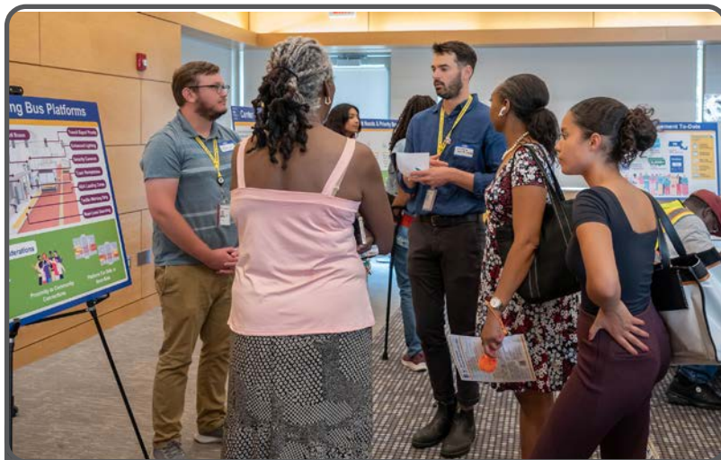
Partissipantis na Reunion Open House di Mattapan na Junhu di 2024 daba ses ideas y ses speransas pa Blue Hill Avenue.

Objetivu di es projetu di renovason propostu é di konekta menbrus di komunidadu ku ses morada y ku restu di sidadi. Konponenti mas inportanti di es projetu é introduson di faxas di rodajen sentral pa autokarru na tudu korredor di Avenida ki ta ben diminui txeu atrazus di autokarru, midjora oráriu di servissu, y da lugar pa mas viajens di autokarru disponível pa 40,000 pasajerus tudu dia. Es esbossu di projetu ta inkluí entri 9 y 11 par di plataformas di enbarki pa sirbi di parajens di autokarru. Kes lugaris foi skodjedu pamodi es ta da pasajerus assessu pa pontus inportanti na komunidadu, sima skolas, parkis, bibliotekas,